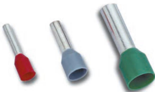
Foto del prodotto / Product image